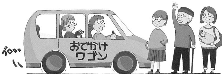
おでかけワゴンのイラスト

湘南地区は、市内の最南西部に位置し、海や豊かな自然環境が残された「湘南」という名にふさわしいイメージの地区です。一方で、この湘南地区は、現在、市内の中で最もダイナミックに街並みが変わっている地域でもあり、圏央道のインター開設、柳島スポーツ公園の開園、浜見平団地の建替えや商業施設であるBRANCH茅ヶ崎の