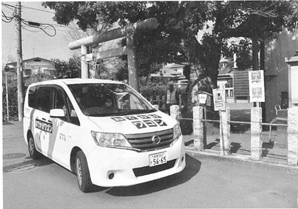
社会福祉法人 翔の会から提供を受けている車両

でかけワゴン」の車両増のため、レンタカー等の車両提供に関して協議を重ねているところですが。