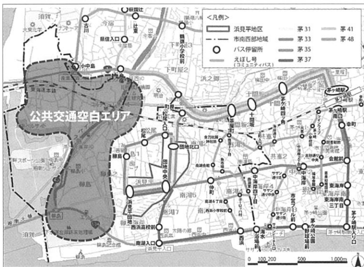
茅ヶ崎市の湘南地区の中の公共交通空白エリア

建設、そして、2025年7月には、道の駅がオープンする計画となっているなど、市内南西部の拠点として位置づけられています。湘南地区まちぢから協議会の構成としては、八つの自治会と各種団体、団体のOBなどの推薦委員、公募委員の21名によって、毎月1回の役員会、運営委員会のほか六つの部会活動などにより、課題を共有し、様々な視点から事業の展開に向けた協議を進めています。