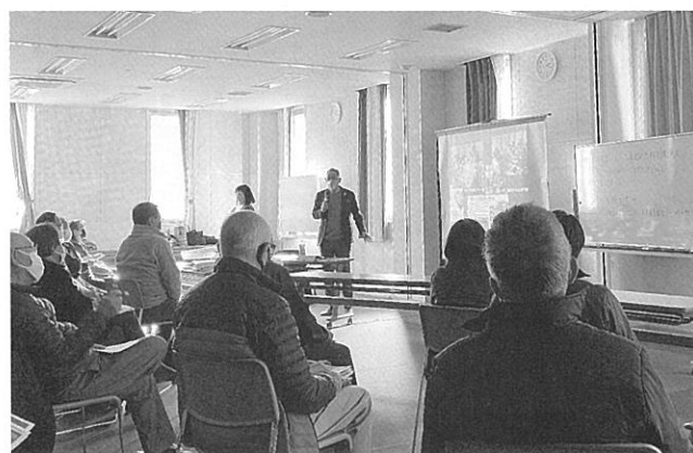
2021年1月に行った、ハンドブック策定記念講演会の様子です

2021年5月より、策定したハンドブックを手に、避難所開設時に運営側に戻る自治会の役員の皆さま向けに出前講座をスタートしました。まずは運営側に回る役員の皆さまに、一緒に考える機会を持っていただくことで、実際に避難所を開設する時に最初からジェンダーの視点を持った避難所運営ができる