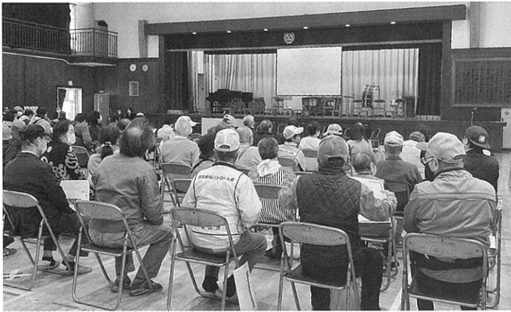
流山本町地区合同の避難所開設訓練を実施。小学生から大人まで 250 名の方にご参加いただきました