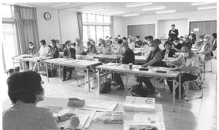
流山おおたかの森地区の防災委員会と各地区の班長を対象にワークショップを実施。依頼のあった地区の状況や参加者、人数によって、研修をカスタマイズしています

私たちは男女共同参画の視点、避難所運営の知識を活かし、男女ともに積極的に防災に参画することを推進します。女性の防災リーダーを育成することにより、災害に遭遇しても女性や子どもたちの安全、安心が守られ、減災につながる地域づくりに貢献します。つまり男女問わず、「じぶんごと」として考えられる人を増やし、特性を生かした避難所づくりを行う手助けをします。一人でも多くの方が知識を持ち、お互いに配慮しあうことができたなら、災害に見舞われた大変な状況の中でも、誰も取り残さない避難所をつくることができると思います。