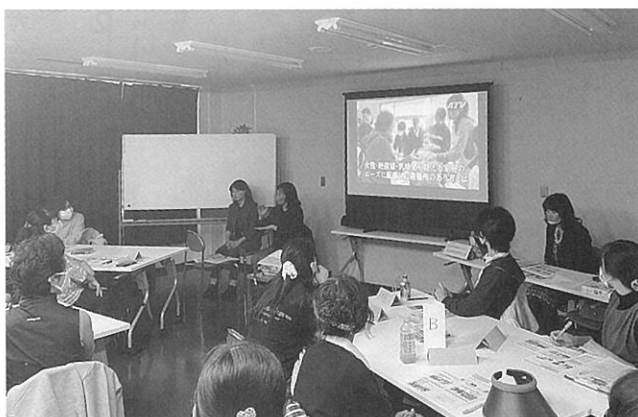
2020年第二期女性防災リーダー養成講座の様子です。デフ（ろう者）の方がメンバーにいらっしゃるのので、手話通訳をお願いしています（写真ホワイトボード前のお二人が手話通訳の方です）

2021年1月には「命と暮らしを守る避難所運営ハンドブック」策定記念講演会を実施致しました。2021年5月から自治会の皆さま向けの出前講座をスタート、2021年7月8月には中学生と一緒に学ぶ夏休み防災ワークショップを実施します。