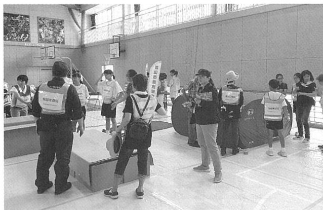
2019年流山市総合防災訓練にて 避難所開設訓練を行いました

災害を経験した事のない私たちが、講座を通して、よりリアルに防災について考え、どのような視点が必要なのか、どんなことに配慮が必要なのかについて考えながらハンドブックを策定しました。私自身、もしかしたら、家から遠く離れた、誰も知らない場所で避難することになるかもしれません。でも、このハンドブックがあれば、避難所を開設する際に声を上げて、こういう配慮が必要です！と声を上げることができると思います。一人