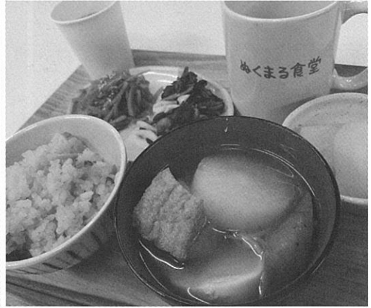
寄付された食材を使ってボランティアさんの手作り料理

になってきた矢先、コロナパンデミック禍によって子どもたちの健康を守る3密回避のため、2020年2月から子ども食堂を休止しましたが、学校も休みになり、給食がないと十分な栄養が摂れなかったり、土日でおにぎり1個しか食べていない子どもがいるとの情報が入り、3月から個別の支援をしています。6月より子育て世帯を食料支援するフードパントリーを開始しました。 当初は、地元企業の寄付やフードバンクの支援で25世帯から始めましたが、報道を観た個人やJAいわて花巻様、いわてブルージャ盛岡様とそのスポンサーの皆様、明治安田生命様やホンダ労働組合様など多くの企業からの寄付が集まり、コープの支援品割引制度や国際ロータリーのコロナ救援資金も活用し、1回で70世帯から80世帯の支援まで規模を拡大、2022年8月まで計29回開催、延べ1671世帯を支援しています。 フードパントリーは子ども食堂に比べると10倍近い経費と多くの食材が必要であり、それらの寄付を集め、仕分ける作業も大変で正直楽ではありません。しかし、スタッフに涙を浮かべながら感謝の気持ちを伝えてくれるお母さんたちの姿や子どもたちの喜ぶ顔や弾んだ声に接することができ、ロータリーの『超我の奉仕』の精神を実感したという会員も多くおり、楽ではないけど楽しい活動となつて