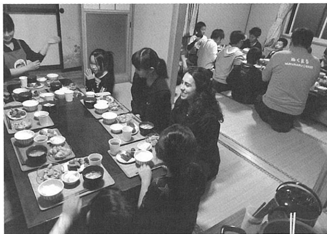
待ちに待った食事の時間。この日はフランスからの留学生も参加

機運が高まり、2017年8月より準備委員会を立ち上げ、花巻市内の小中学校を訪問してヒアリングし、色々な解決すべき課題と共に『目に見える貧困は少ないが、地域とのつながりが希薄な家庭で潜在的な貧困があり、支援を必要としている』という調査結果を得て、2018年2月に花巻ロータリークラブ主催、花巻市社会福祉協議会共催の実行委員会を結成、子どもたちが気軽に集まり、家庭的な雰囲気で作りの食事を食べたり、遊んだり、勉強をする等、安心して過ごすことができる場所、また問題を抱えた親子が様々な相談ができる機能を持ち合わせた「地域の居場所づくり」を目的とし、貧困対策のイメージが強い子ども食堂という名称ではなく、誰でも心もお腹もいっぱいになるあったかい場所にしたいという願いを込めて「ぬくまる食堂」という名称とすることしました。 開催場所は花巻市社会福祉協議会が保有している市役所近くのサテライトスペースを借り、2月にキッチンや備品、のぼりやのれん、スタッフエプロンなどを購入準備し、3月に試食会や学童を招いての3日間のプレオープンでの反省点を踏まえて5月から本格オープンしました。毎月、第2、第4火曜日の2回、15時30分～19時30分の間、宿題の見守り、将棋やおセロ、バルーンアートの得意な会員が技を伝授したり、カードやボードゲームで遊