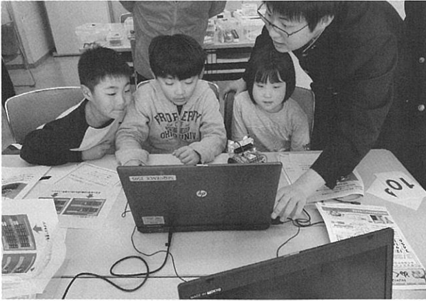
地元の高校生が講師になっためくまるアカデミー 「センサー自動車組立とプログラミング」