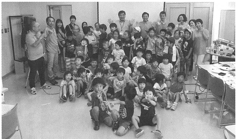
めくまるアカデミー後の写真 (最後列中央が筆者)