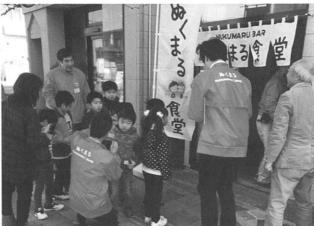
ぬくまる食堂プレオープンの様子