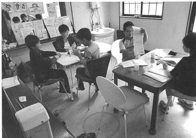
遊ぶ前にはまず宿題

機運が高まり、2017年8月より準備委員会を立ち上げ、花巻市内の小中学校を訪問してヒアリングし、色々な解決すべき課題と共に『目に見える貧困は少ないが、地域とのつながりが希薄な家庭で潜在的な貧困があり、支援を必要としている』という調査結果を得て、2018年2月に花巻ロータリークラブ主催、花巻市社会福祉協議会共催の実行委員会を結成、子どもたちが気軽に集まり、家庭的な雰囲気で作りの食事を食べたり、遊んだり、勉強をする等、安心して過ごすことができる場所、また問題を抱えた親子が様々な相談ができる機能を持ち合わせた「地域の居場所づくり」を目的とし、貧困対策のイメージが強い子ども食堂という名称ではなく、誰でも心もお腹もいっぱいになるあったかい場所にしたいという願いを込めて「ぬくまる食堂」という名称とすることしました。 開催場所は花巻市社会福祉協議会が保有している市役所近くのサテライトスペースを借り、2月にキッチンや備品、のぼりやのれん、スタッフエプロンなどを購入準備し、3月に試食会や学童を招いての3日間のプレオープンでの反省点を踏まえて5月から本格オープンしました。毎月、第2、第4火曜日の2回、15時30分～19時30分の間、宿題の見守り、将棋やおセロ、バルーンアートの得意な会員が技を伝授したり、カードやボードゲームで遊