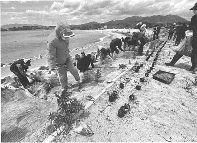
工事完了間近の大谷海岸