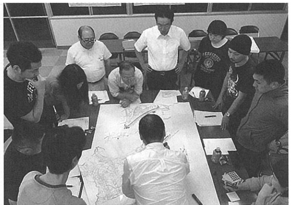
住民案を作成するワークショップ