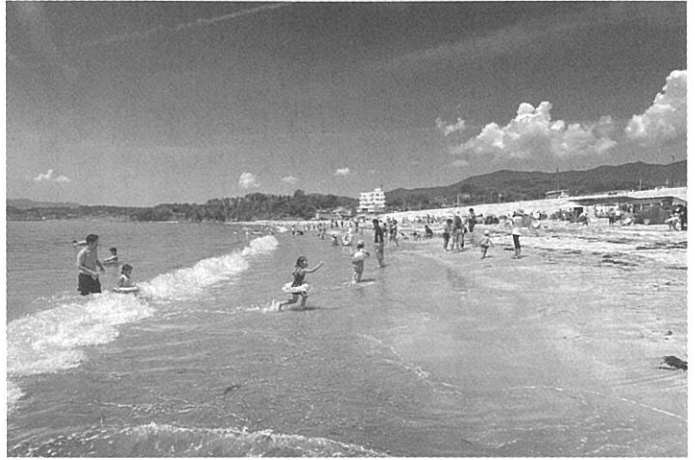
海水浴場がオープンし賑わいが戻ってきた

り、大谷地区では防潮堤の賛否による対立構造を回避し、地域の共通する想いが大谷海岸の砂浜を守ることであることを確認し合いました。同年11月、署名と復興計画は気仙沼市長へ提出されました。