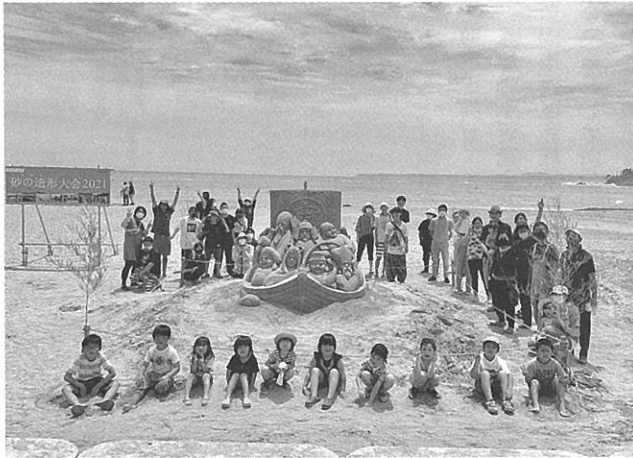
親子参加型の地域イベントとして開催した「砂の造形大会2021」