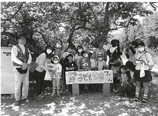
日進絆子ども食堂ファームの収穫体験