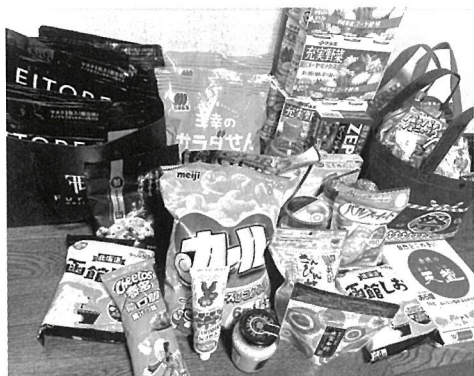
ファミリーマート店での食品寄付

2021年には日進市内のファミリーマート三本木町店で、365日24時間のフードドライブのご提案を承諾、開始いただき現在では全国2000軒のファミリーマートで展開中です。コンビニフードドライブの先駆けともなり、広く認知いただき毎月たくさんの方の物資を多くの方から寄せていただいております。5月には新たに小学校のPTAとフードド