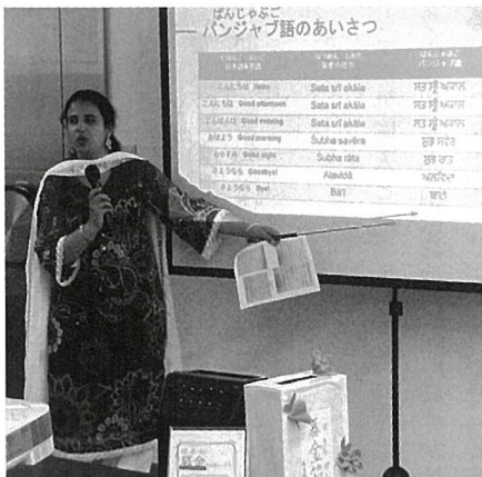
地域イベントでの発表（インド・パンジャブ語の紹介）

域における居場所づくりを目指して活動している。地域住民である日本人ボランティアは、教員（大学教員・元大学教員や高校教員）、現役大学生、退職者を含む会社員、介護士、主婦や経営者と幅広く、豊富な経験や人脈などから助言、サポートできる強みがある。また外国人とは互いに地域の生活者として対等な関係性を構築することを念頭においている。