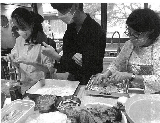
メンバー宅でのベトナム料理パーティー

・調査…外国人労働者受け入れ企業へのアンケート・インタビュー ・地域と連携した活動…「ゼロ円マーケット」