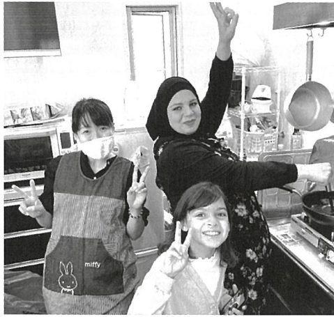
シリアンフェアー (シリア・シリアのお菓子紹介)

での外国人スピーチ・各国料理参加協力、「粉河中津川クリーン大作戦および交流パーティ」への参加協力 ・地元企業と連携した交流活動…外国人従業員向け出張講座(和歌山弁、ことわざ比較、防災・防犯時の日本語、「減災体験」など)