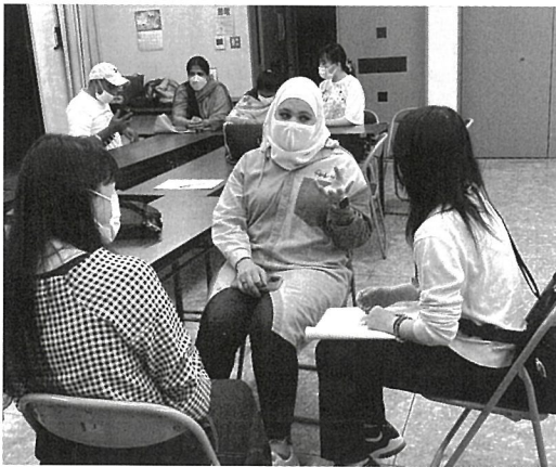
活動の様子（水曜日晚）

活動の目的は、△おしゃべり▽を通じて日本語を話す機会を設け、和歌山県紀北エリアに住む外国人が安心して暮らせるためのこ